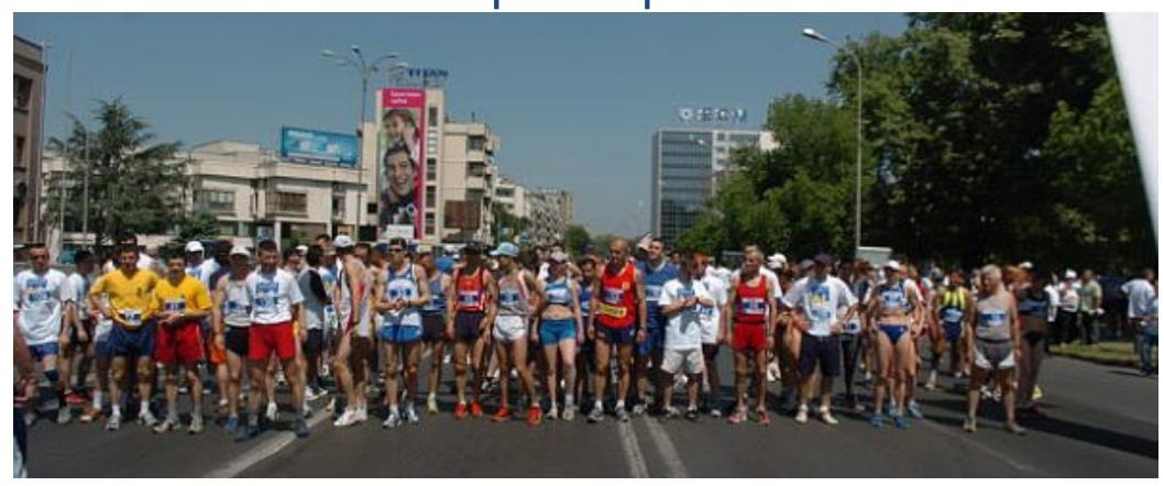
In 2012 more than 4000 participants